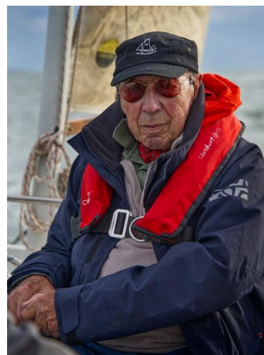
Tiens bon la barre