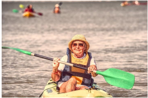
Les femmes, toujours à l'honneur