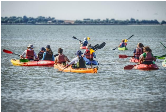
« Restons groupir »