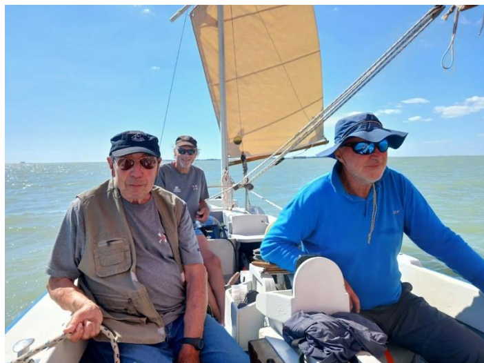
Heureux qui comme Ulysse...