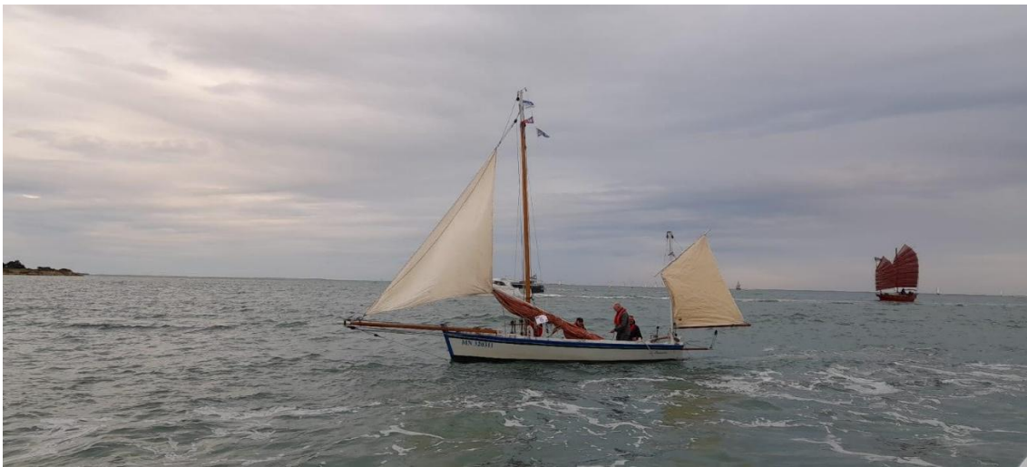
Plaisir de naviguer au vent