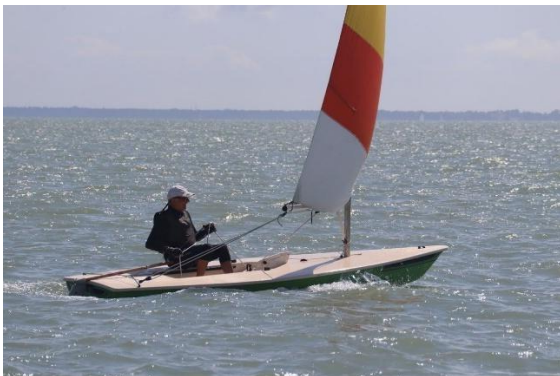
Toujours soif de victoires !