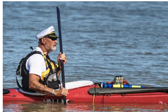
Popeye prêt à intervenir