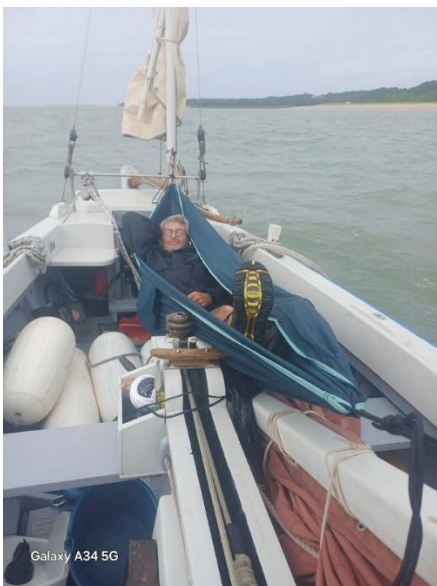
Il a rejoint une autre Galaxie !