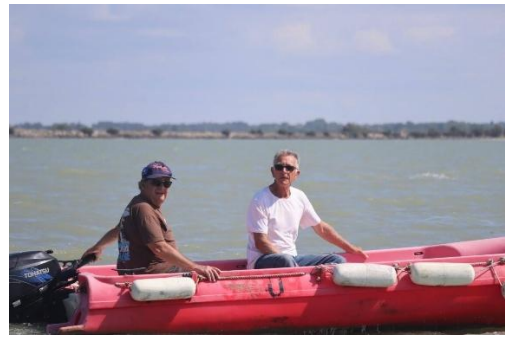
La sécurité d'abord