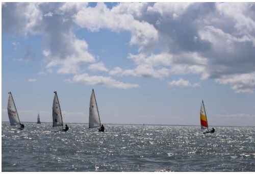
Jour de régates