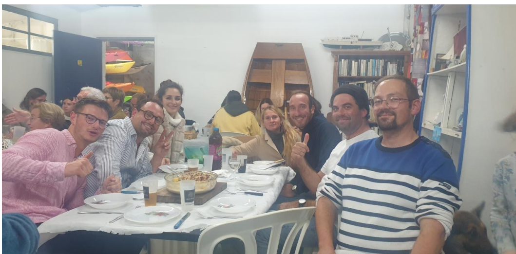
Soirée Tartiflette préparée par et avec des jeunes !