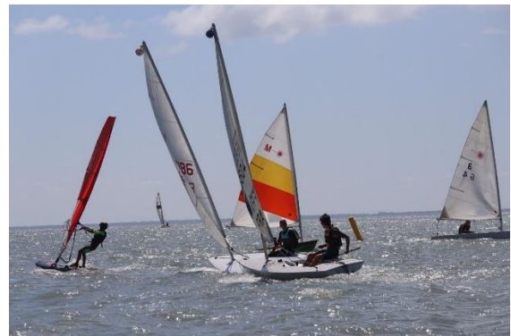
La bouée, par babord ou tribord ?