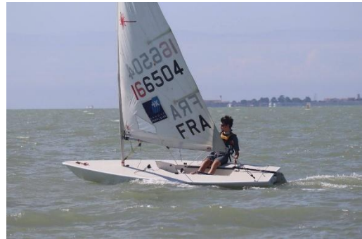
La relève se profile