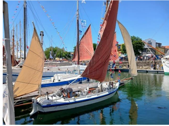
La Fourasine en exposition à la Rochelle