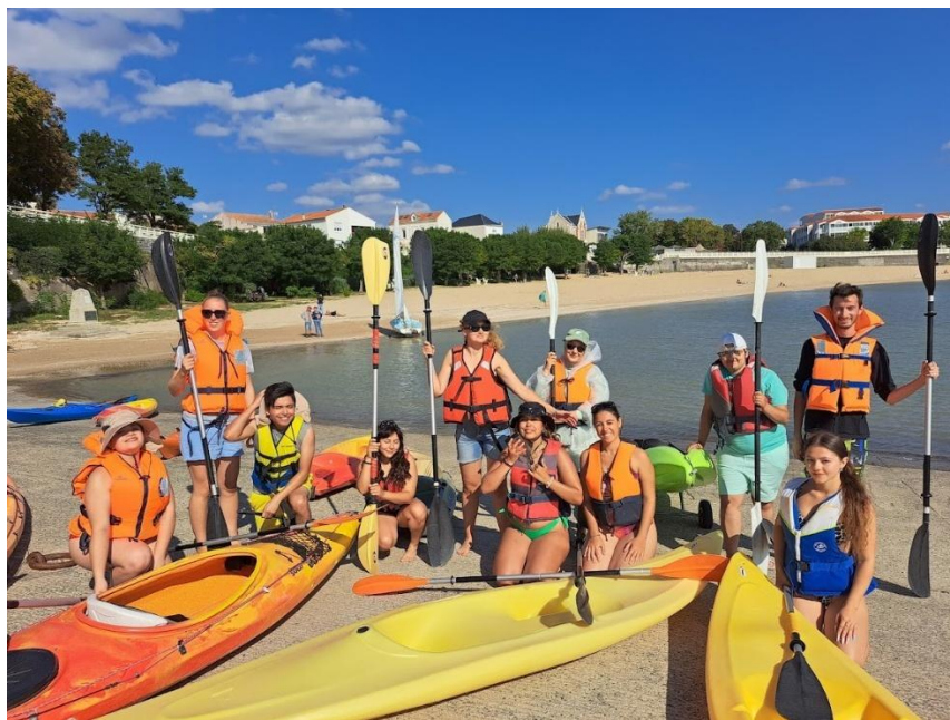
Les jeunes du chantier international