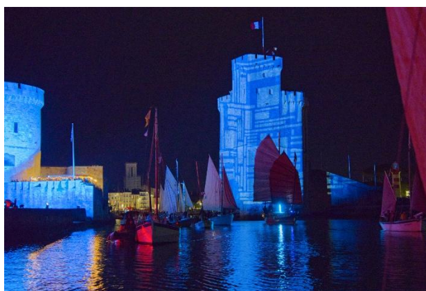
Voiles de nuit à la Rochelle