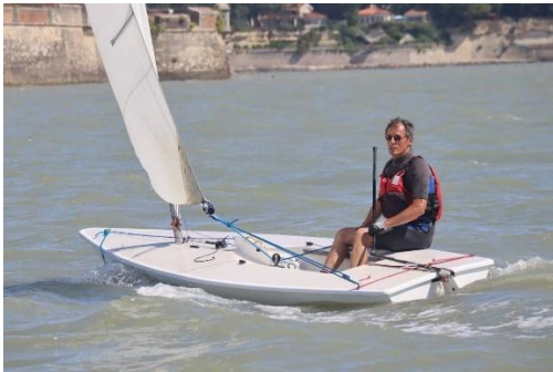
Heureux comme Patrick