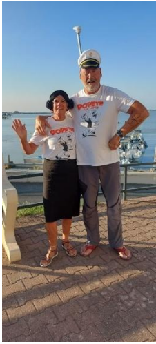
Popeye et Olive