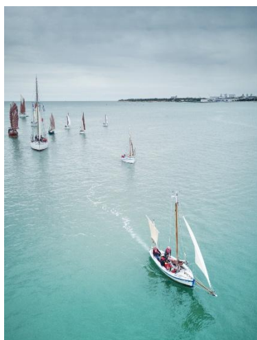
Direction Le Vieux Port